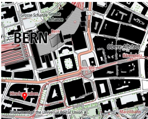
punkt.null, Maulbeerstrasse 10, 3011 Bern