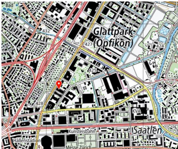
Haus der Farbe, Thurgauerstrasse 60, 8050 Zürich